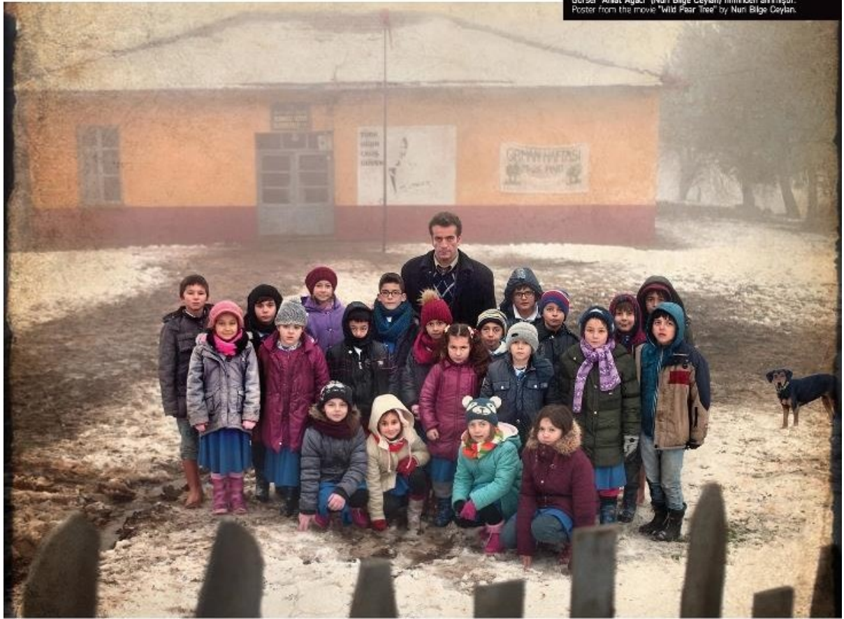
Görsel "Ahlat Ağacı" (Nuri Bilge Ceylan) filminden alınmıştır. Poster from the movie "Wild Pear Tree" by Nuri Bilge Ceylan.